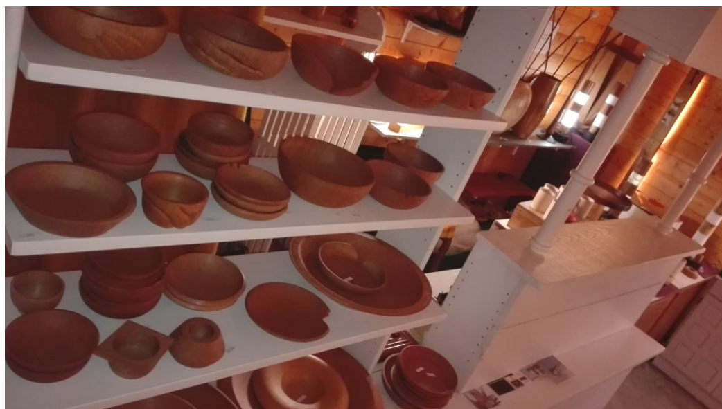
Exemples de divers ramequins et petits bols